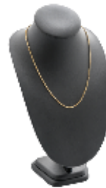
COLLANA LUXURY IN ARGENTO