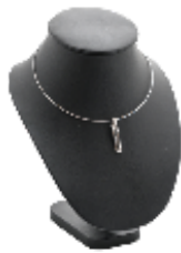
COLLANA PIETRA AMETISTE