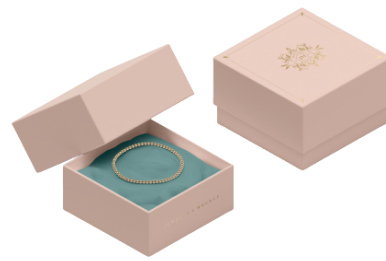
BRACCIALE ARGENTO PERLA