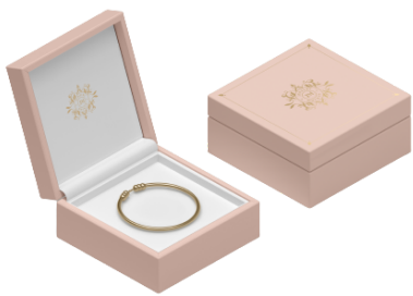
BRACCIALE IN ARGENTO ROSATO